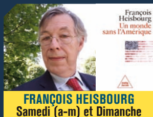
FRANÇOIS HEISBOURG Samedi (a-m) et Dimanche