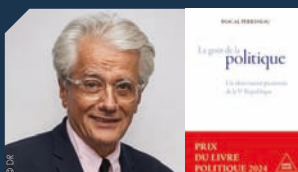
PASCAL PERRINEAU Samedi et Dimanche (mat)