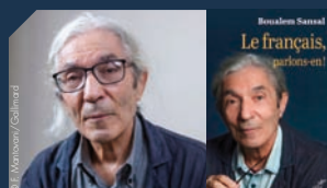
BOUALEM SANSAL Samedi et Dimanche (mat)