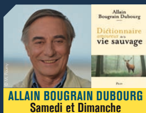
ALLAIN BOUGRAIN DUBOURG Samedi et Dimanche