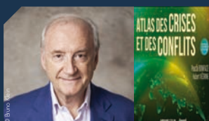
HUBERT VÉDRINE Samedi (a-m)