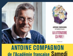
ANTOINE COMPAGNON de l'Académie française Samedi