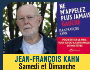
JEAN-FRANÇOIS KAHN Samedi et Dimanche