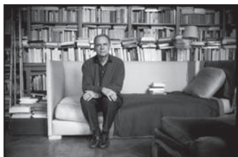
Patrick Modiano, chez lui le 28 décembre 2004