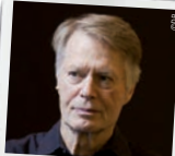
G.M.G. Le Clézio