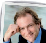
Didier van Cauwelaert