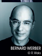
BERNARD WERBER