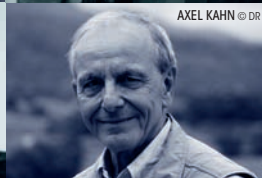
AXEL KAHN