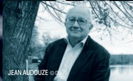
JEAN AUDOUZE