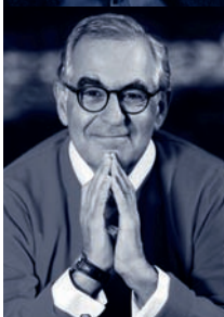
METIN ARDITI