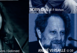
ANDRÉ VERSAILLE