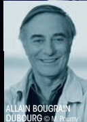
ALLAIN BOUGRAIN DUBOURG