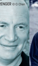
CARLO STRENGER