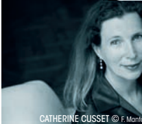
CATHERINE CUSSET