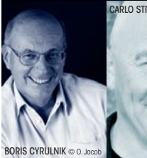
BORIS CYRULNIK