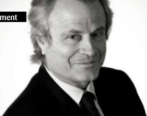
► Franz-Olivier Giesbert