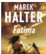
► Marek Halter

► 23 rue Gaston de Saporta (entrée libre).