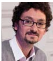
► David Foenkinos

► Amphithéâtre de la Verrière, le 12 mars à 20h