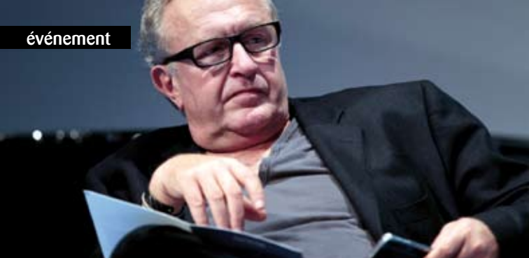
► Michel Field