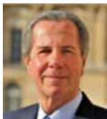
► J.-L. Debré

>14h Rencontre avec Jean-Louis Debré, président du Conseil constitutionnel, écrivain, autour de son dernier livre Le Monde selon Chirac (Tallandier), animée par Franz-Olivier Giesbert, journaliste, éditorialiste au Point , écrivain.