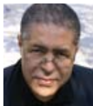
► M. Chebel