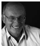
► Boris Cyrulnik © Odile Jacob

Entrée libre dans la limite des places disponibles.