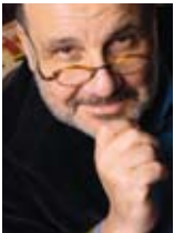
► Serge Moati

Richard Millet est né en Corrèze. Il a passé son enfance au Liban. Il est l'auteur de nombreuses œuvres parmi lesquelles Un balcon à Beyrouth , Cité perdue , Ma vie parmi les ombres , le Sentiment de la langue , prix de l'essai de l'Académie française. Il publie le Dictionnaire amoureux de la Méditerranée (Plon).