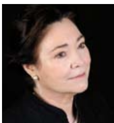
▶ Paule Constant de l'Académie Goncourt Présidente du Centre des Écrivains du Sud - Jean Giono

Pendant quinze ans j'ai interrogé les écrivains qui participaient aux Journées des Écrivains du Sud sur les sources et les formes de leurs lectures. Comme le public, quels lecteurs ont-ils été de romans d'aventures, de romans d'amour, de contes de fées ? Comment ont-ils rencontré leurs héros préférés ? Que nous soient données pour longtemps « la passion de lire et la force d'écrire ». Paule Constant