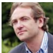
► Didier van Cauwelaert

Rencontre-Lecture autour de Didier van Cauwelaert.