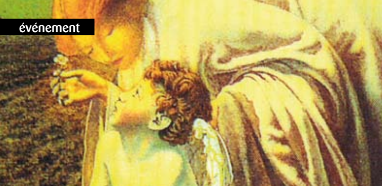
► Les Vilains Petits Canards / (Odile Jacob) Boris Cyrulnik