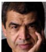
► Daniel Picouly

Franck Pavloff a parcouru le monde en travaillant dans le secteur du développement social et de la défense du droit des enfants. Après le succès planétaire de Matin brun , il a publié chez Albin Michel Le grand exil (2009), ou L'Homme à la carrure d'ours (2012) et récemment L'Enfant des marges (Albin Michel).