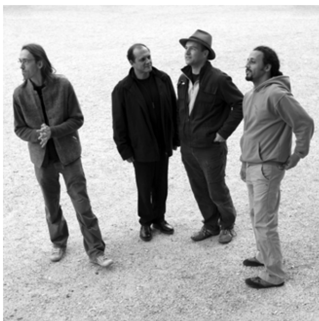
Anouar Brahem Quartet