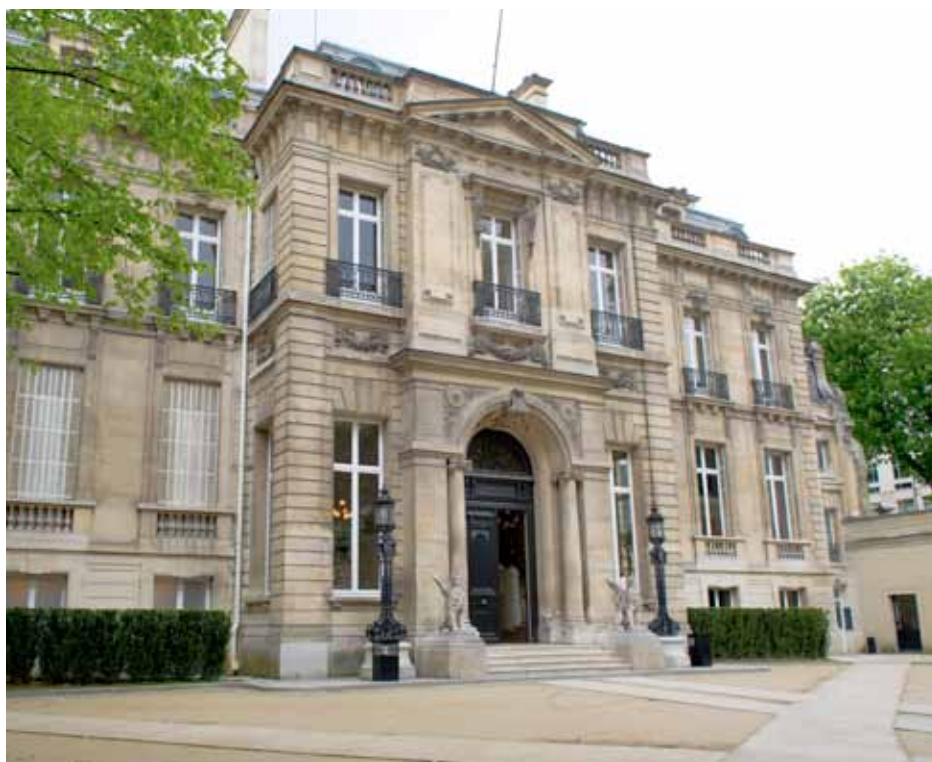
Hôtel Salomon de Rothschild