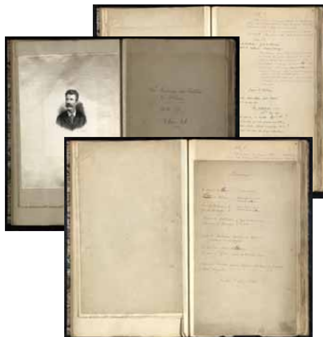
Le manuscrit de La Trahison de la comtesse de Rhune : Gustave Flaubert revu par Guy de Maupassant.