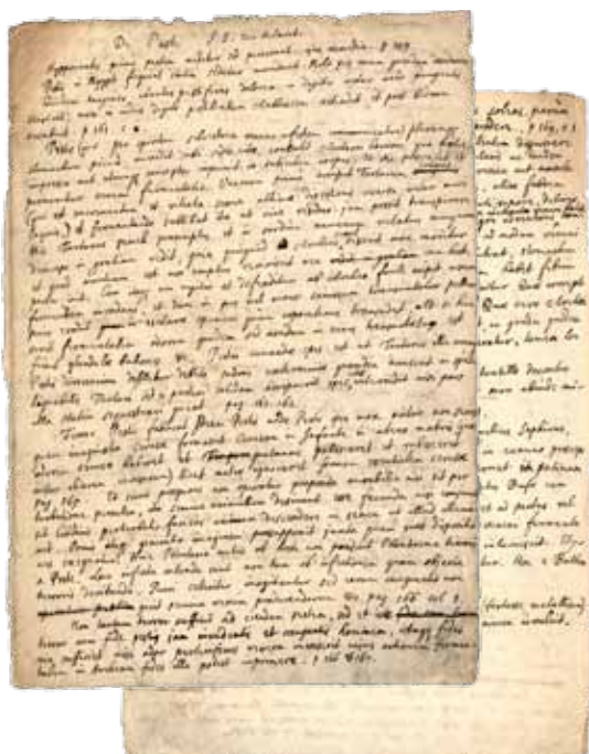
Un manuscrit autographe en latin sur la peste d'Isaac Newton.