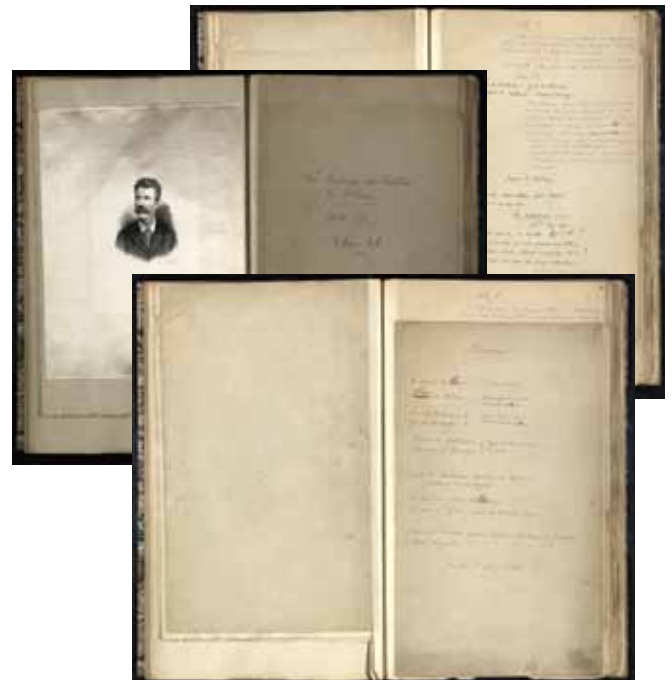
Le manuscrit de La Trahison de la comtesse de Rhune : Gustave Flaubert revu par Guy de Maupassant.