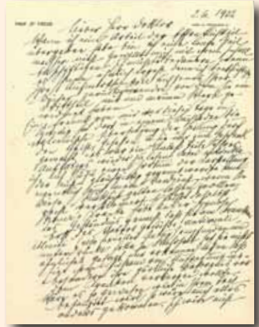
▲ Lettre autographe en allemand signée de Sigmund Freud, adressée à Stefan Zweig, datée du 2 octobre 1932, Vienne.

Ainsi, les écrits de Louis XIV, Catherine II de Russie, Napoléon Bonaparte, Gandhi, Roosevelt, de Gaulle, etc., ponctuent le parcours de cette exposition de documents autographes. La suite de la visite permet de plonger dans le processus de création d'œuvres d'écrivains majeurs : Goethe, Balzac, Hemingway, Saint-Exupéry, Breton ou Cocteau... Les relations entre auteurs et compositeurs sont également dévoilées grâce à la correspondance de Sand et Chopin ou Proust et Hahn. Enfin, les manuscrits de Kepler, Darwin, Freud, Curie, Einstein, etc., apportent un nouvel éclairage sur les bouleversements entraînés par leurs travaux dans notre perception de l'homme et de l'univers.